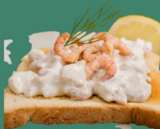
Ricotta + crevettes + aneth