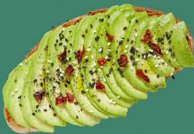
Avocats + ail + paprika + piment