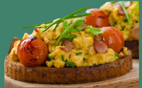
Œufs brouillés + bacon + ciboulette