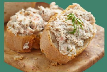
Rillettes de thon