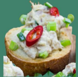
Maquereaux + moutarde