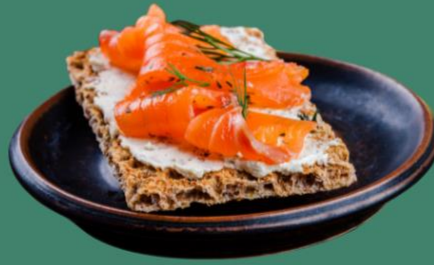
Ricotta + saumon fumé + citron + aneth