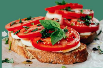
Tomates + mozzarella + basilic