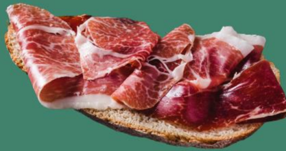
Chèvre frais + jambon sec